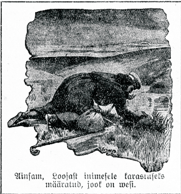
Uinam, loojast inimesele karastuseks määratud, jook on wesi.

Kurwameelsus segab mao loomulikku tegevust ja mõjutab, et toit meie seedimiskanaalis ainult aeglaselt edasi liigub.