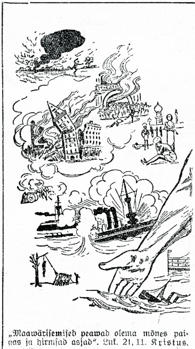
„Maawärilemised peawad olema mõnes paigas ja hirmsad asjad“. Lul. 21, 11. Kristus.

Mitmed kümned majad muuli ääres olid wõllu, laugelid rusudena kogu ja mõned wajufid täiesti maa alla. Palju rahwast, kes enda omakseid ja sõpru olid saatma tulnud, olid parajasti muuli peal seisnud, lahtiwatele siidamille õnnesoowe kaasa hüüdes.