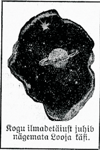
Rõugu ilmadetäiust juhhib nägemata Looja käsi.

fesse lahkhelid sünnitanud ja häda ning wiletust wiimase wõimaluseni suurendanud. Kas Piibel meile siis ka sellest seisukorrast wäljapääsu teed ei näita? Ja, kindlasti! Kuid selleks, et ta meile õige tee näitajaks wõiks olla, peame ise eneste seisukohta muutma.