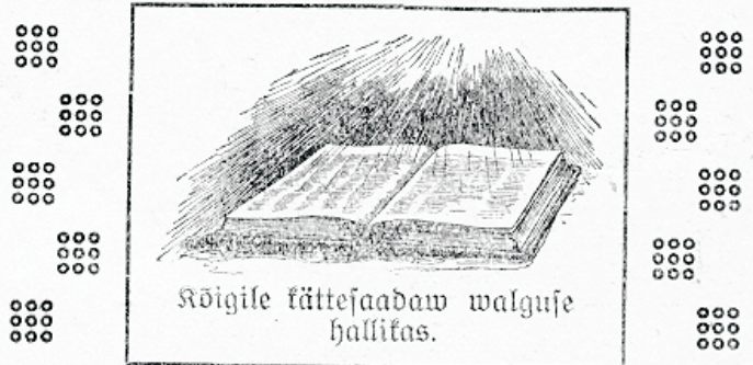
Kõigile kättefaadawalguse hallitas.

Tähtis on ka selle aasta algusel iseäralikult tõsiselt selle pääle mõelda. 1924 aasta pakub jällegi igale ühele uuesti, nii kaua kui armu aeg kestab, wõimalust inimesesoo parema sõbraga tutawaks saada ja end kindlamalt Jumala sõna pääle toetada.